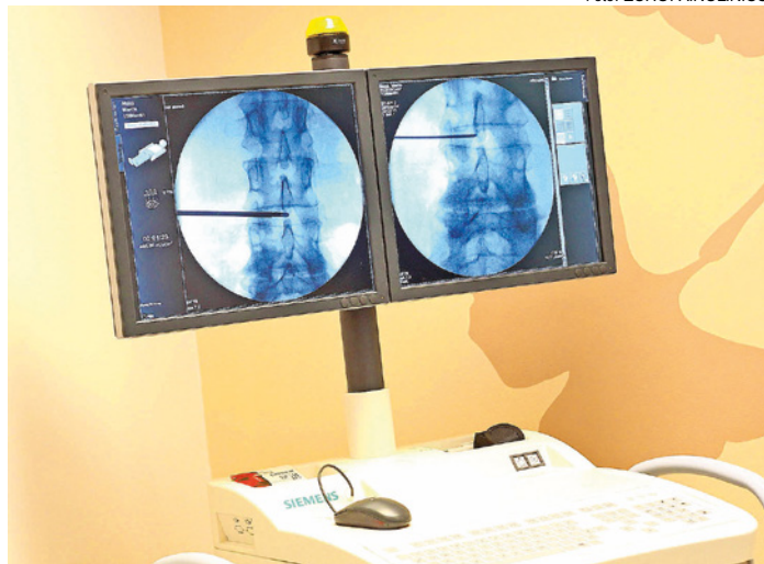
Oprava: Medzistavcovú platničku už vedľa lekári dať dokopy aj bez operácie.

medzirebrové svaly a akýkoľvek pohyb hrudnej chrbtice ich neskutočne bolí.