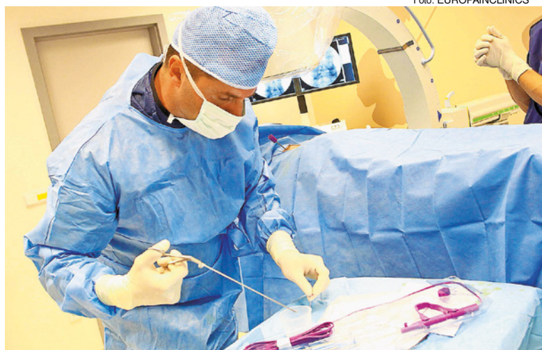
Cez jeden vpich: Aj takto dokážu opraviť lekári niektoré poškodené platničky.